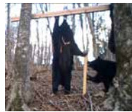
▲カメラトラップで撮影したクマの様子

森林を住み処とする動植物の生態を見守りつつ、シカの防除や病害虫などによる森林被害を調査します。