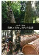
▲小学校5年生配布の副読本