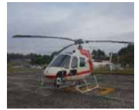
▲ヘリによるナラ枯れ被害調査

💡 税の活用状況は県ホームページ上での公開や、県庁屋上ギャラリーなどの企画展示を通じて広報しています。