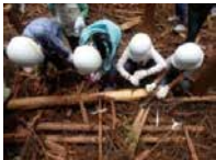
▲「森の学校」間伐体験

私たちの生活と森林との関係など、森林と環境について積極的に学べる機会を提供します。